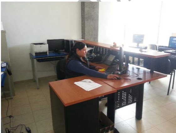
Recepción área de computo

Contamos con dos centros de cómputo, con equipo nuevo disponible para los estudiantes y docentes que lo requieran, en dichos espacios se llevan a cabo clases y cuenta con equipo móvil para proyección en aulas que no cuentan con este servicio. En general el equipo se encuentra en buen estado, es suficiente para la cantidad de alumnos.