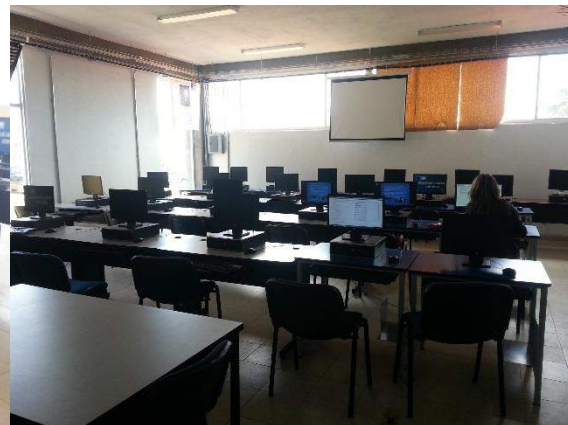
laboratorio de consulta