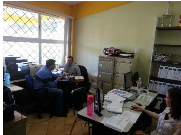
coordinación facultad de contaduría