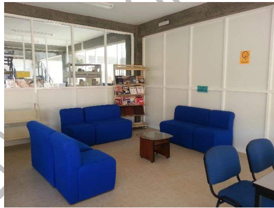
sala de lectura