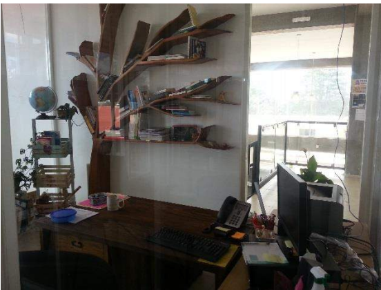
Cubículo de lenguas y letras (PTC)