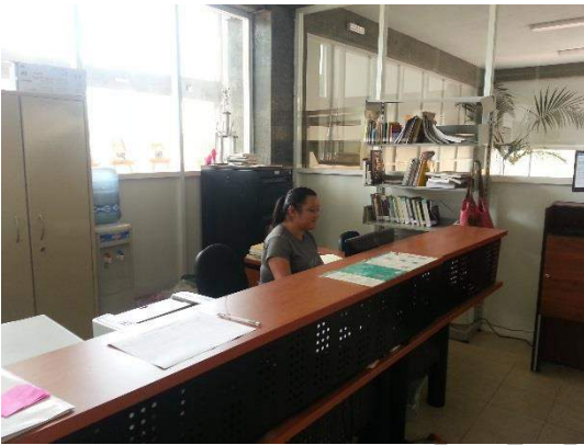
Recepción de biblioteca

Contamos con una biblioteca general, en la cual se concentran los libros de todas las facultades para la consulta de cualquier alumno(a), cuenta con una recepción para poder ingresar, consulta electrónica de libros, sala de lectura y mesas de trabajo