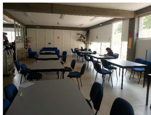
Área para Consulta de libros